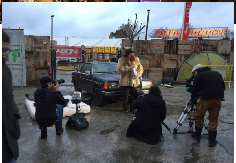
Tournage The Bride

Objet sonore insolite, punk et décalé, cette B.O. marque les esprits autant que les images qu'elle accompagne. Bonne écoute !