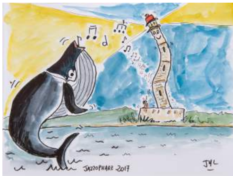
Croquis Jean-Yves Lacombe